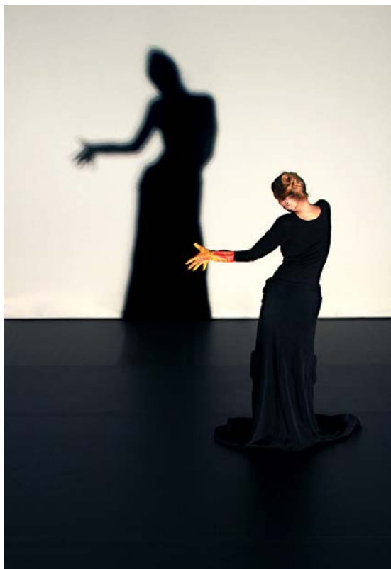
Carolyn Carlson

Pour la première fois, la Fondation présente une sélection d'œuvres Lumières issues de sa collection. Témoignage d'un engagement pour faire reconnaître la lumière comme matériau de création, elle a constitué au fil des ans une collection inédite. Pour cette première édition, des œuvres peu ou jamais exposées de Raoul Dufy , Man Ray , Julio Le Parc ou encore François Morellet seront présentées.