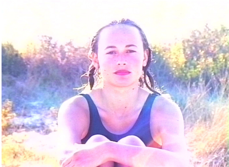
Ludivine, Ange Leccia © Ange Leccia © Adagp, Paris, 2025

Le libre arbitre n'est-il qu'une vaste illusion ou reste-t-il un espace de résistance et de création ? Les avancées récentes en neurosciences mettent en lumière des processus inconscients qui influencent nos choix, brouillant frontières entre ce que nous contrôlons et ce qui nous échappe.