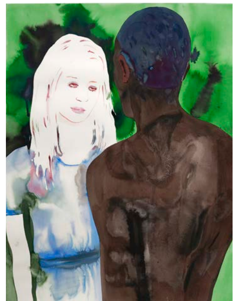
Françoise Pétrovitch, Selfie , Sans titre , Sans titre (2023, 2024, 2020), Courtesy Semiose, Paris. Photo : Aurélien Mole