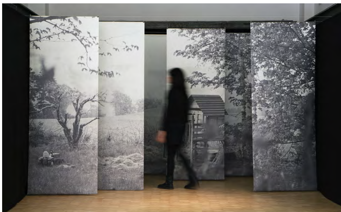
Katherine Longly, FAILED I HAVE, IN EXILE I MUST GO

En proposant un regard empathique sur les hikikomoris, Katherine Longly démystifie nos visions caricaturales de l'isolement en ligne. Des tablettes numériques font apparaître puis disparaître le témoignage de ces personnes isolées : on découvre que leur monde virtuel a un rôle puissant leur permettant de canaliser leurs angoisses et de maîtriser leurs liens sociaux.