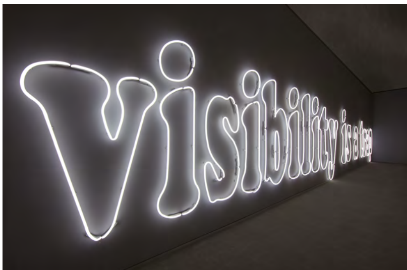
Laurent Grasso, Visibility is a Trap

que nous accordons à ce qui est mis en lumière. Cette œuvre nous rappelle ainsi que la vérité peut aussi résider dans l'invisible.