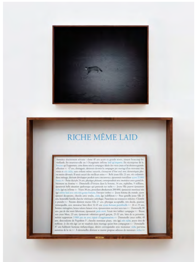
Sophie Calle, Riche même laid