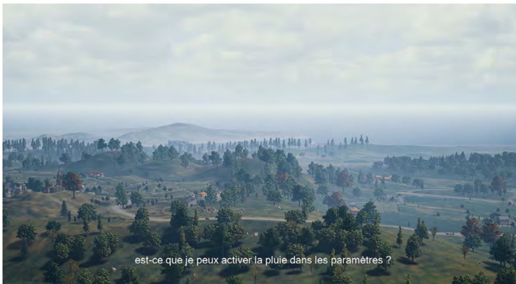
Nicolas Bailleul, Les Survivants

Les Survivants raconte une expérience sociale du jeu en ligne : moqueries, discours absurdes, rires, mais aussi échanges sincères qui se transforment parfois en amitiés. Dans ces dialogues, la chambre et la forêt deviennent des espaces de rencontre où les frontières avec le réel se brouillent et se recomposent.