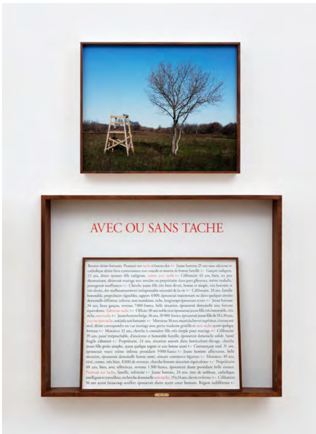
Sophie Calle, Avec ou sans tâche

À partir de ces textes, Sophie Calle transforme la conquête amoureuse en une surprenante partie de chasse. Cette série révèle que les mœurs évoluent au fil des années mais les procédés de rencontres, eux, traversent le temps.